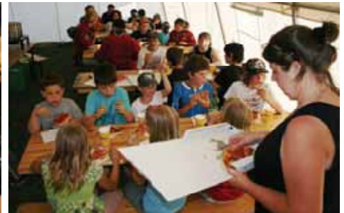
„Raubtierfütterung im Großzelt...“