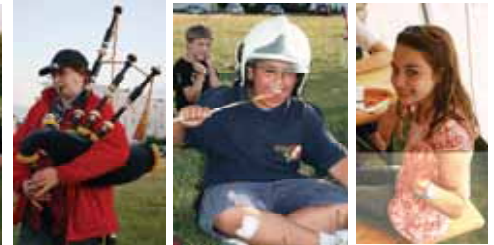
Dudelsack, mit Helm u. strahlende Augen