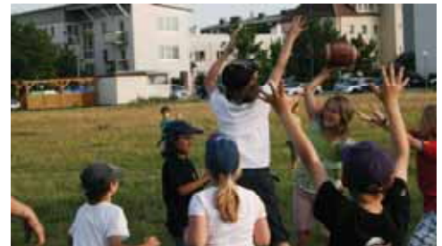
Mannschaftwettbewerb auf der „Had“