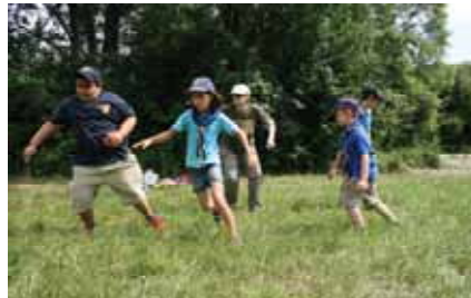
Gemeinschaftswettbewerb in der Au