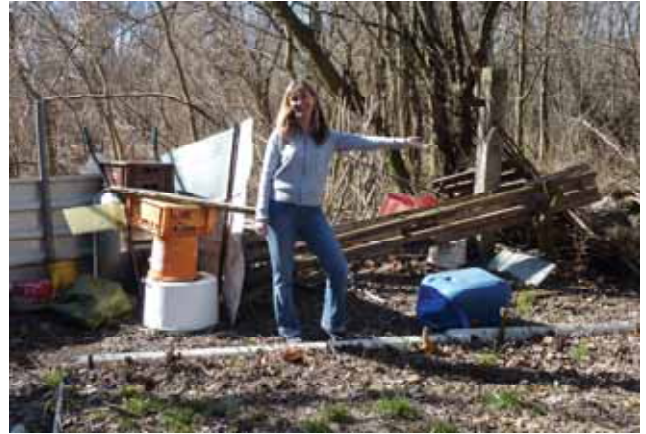
Illegale Rodungen, und Müllablagerungen in der Pottendorfer Au im Jahr des Waldes