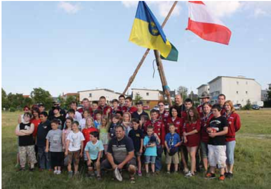
Flaggenparade durch Feuerwehrjugend, SC-Jugend und Pink-Ladies, Pfadfinder