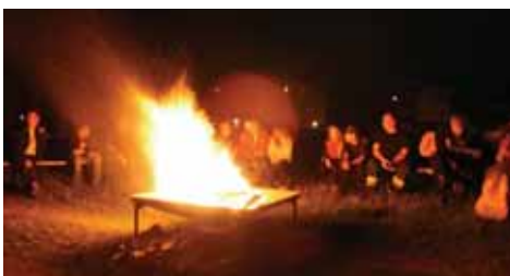
Lagerfeuer unterm Sternenhimmel