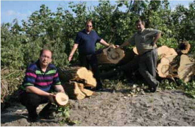
Wieder Bäume bei der Linz Textil gefällt