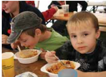
Brauners wunderbare Had-Spaghetti