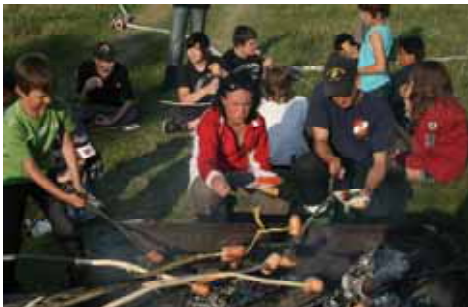
Würstelgrillen am Lagerfeuer