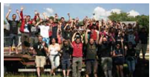
Sieger-Wanderpokal bis nächstes Jahr