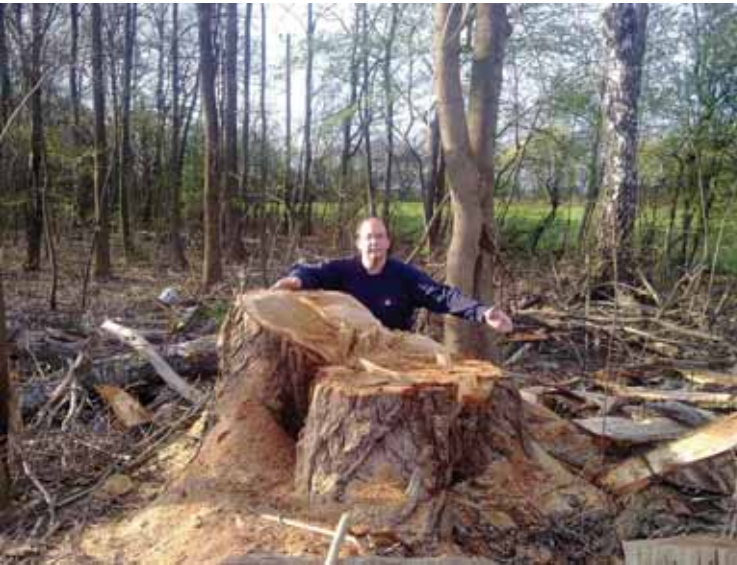
Alter Riese gefällt im Gemeindefeld