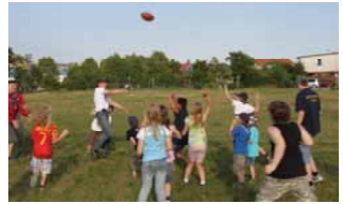
American Football auf der „Had“