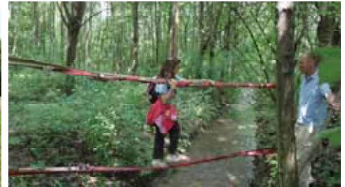
Mutproben über Gewässer in der Au