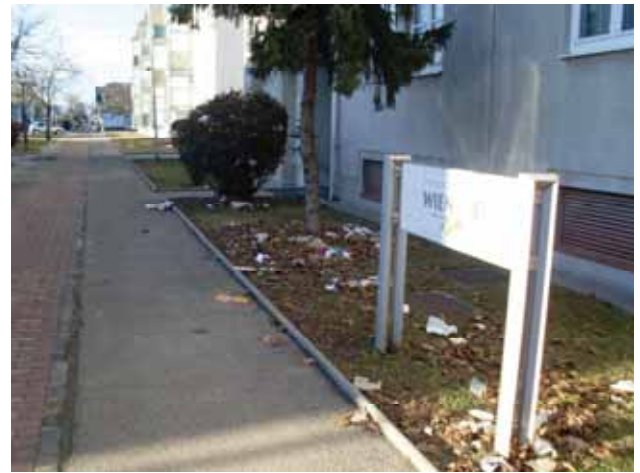
Müll in Felixdorf - Bauhofleiter Straub uninteressiert?

Bushaltestelle gegenüber dem Gemeindeamt ist seit Monaten ungeräumt. Abstoßende, ekelige Flüssigkeiten über sämtliche Glasscheiben - und das im täglichen Blickfeldes des Bürgermeisters.