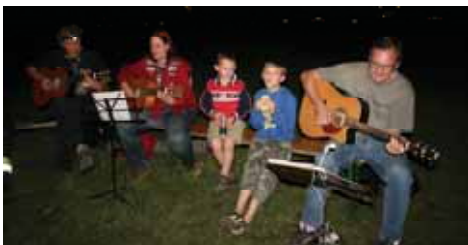
Mit Gitarrenklängen durch die Nacht