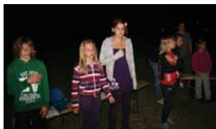
„Deep in my heart“, sangen wir