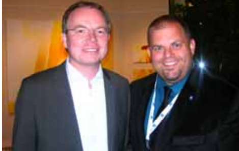
Umwelt LR Dr. Pernkopf und GR Ing. Smuk

Durch das Tauschen alter Haushaltsgeräte und Heizungspumpen gegen neue energiesparendere Geräte entsteht für jeden Felixdorfer Bürger ein Doppelgewinn. In einem durchschnittlichen Haushalt können bis zu 200 Euro Stromkosten pro Jahr eingespart werden.