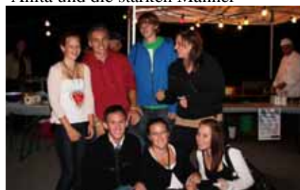
Gemeinschaft der Jugendlichen