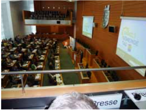
Umweltgemeindetag - Rohstoffende 2018?

Erdöl, Erdgas, Treibstoffe werden gemeinsam mit anderen Rohstoffen in absehbaren Jahren nicht mehr erhältlich sein?! Bei den Bürgern und in der Gemeinde Felixdorf ist schnelles Umdenken und Handeln gefordert. Neue Wege der erneuerbaren Energien sind in gemeinsamer Zusammenarbeit zu finden.