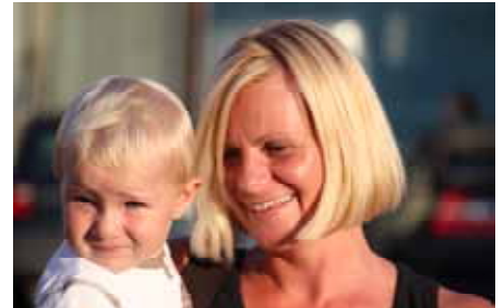
Sonnenblumen in Felixdorf