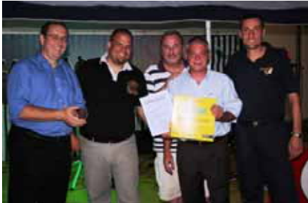
Danke dem ARBÖ Felixdorf

So überreichten wir die Danke-Plakette an zahlreiche Obmänner und -frauen stellvertretend für Ihre Mitglieder für den beispielhaften Einsatz und das vorbildliche Engagement des Vereines. Ebenso überreichten wir die Urkunde von Landeshauptmann Dr. Erwin Pröll in Dank und Anerkennung der Leistung für Niederösterreich.