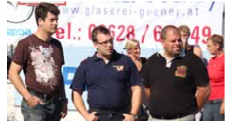
Wirtschaftskompetenz und Jugend