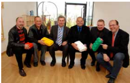
Bauherren der Zukunft der Jugend Felixdorfs

Die VP Felixdorf wünscht jeder einzelnen Familie und jedem einzelnen Kind alles Gute auf Ihren Lebenswegen.