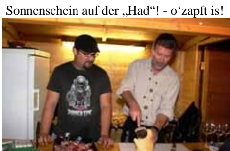
Köstlichkeiten in der neuen Wein-Hütte