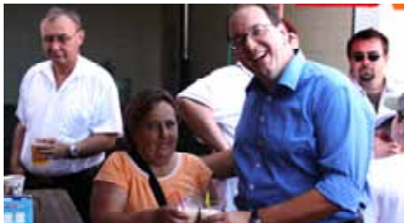
gemeinsam statt einsam