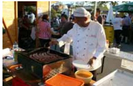
die besten Würstel vom besten Koch