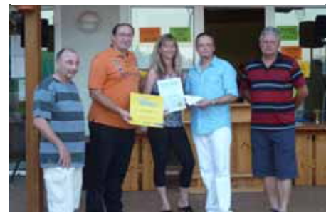
Danke dem 1. TC Felixdorf