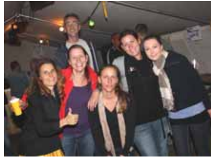
riesen Stimmung im Bar-Zelt