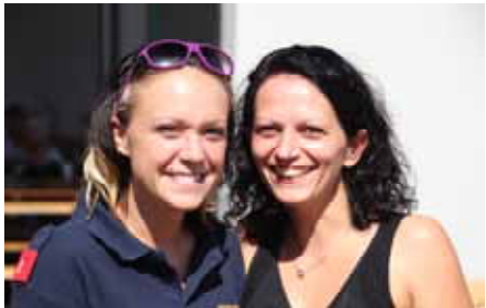
Schönheit beginnt in Felixdorf