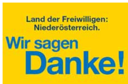
Danke allen anderen Freiwilligen