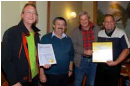
Danke dem Tandemclub Felixdorf