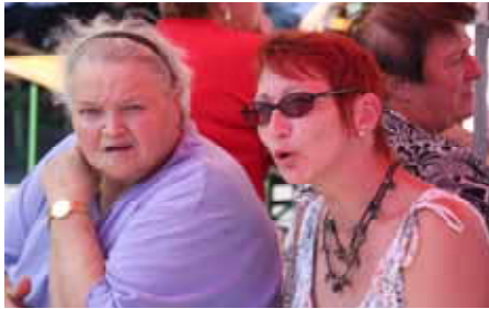
Erfahrung - Herz - Verantwortung