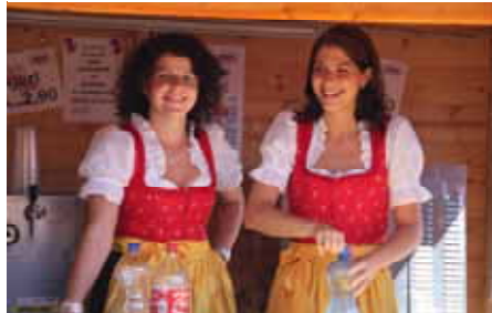
Feuerwehrdirndl innen und außen