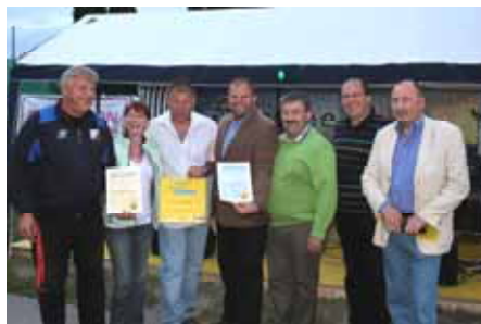
Danke dem 1. SC Felixdorf