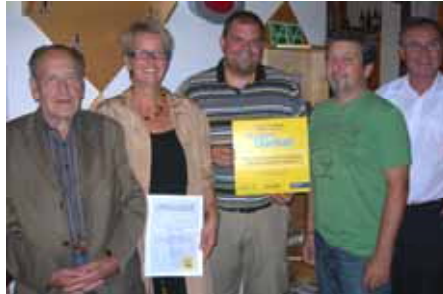
Danke dem Auverein Felixdorf