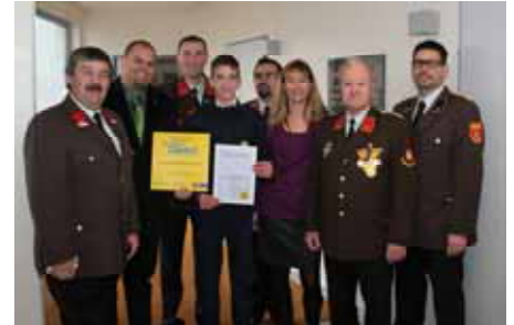
Danke der Freiwilligen Feuerwehr