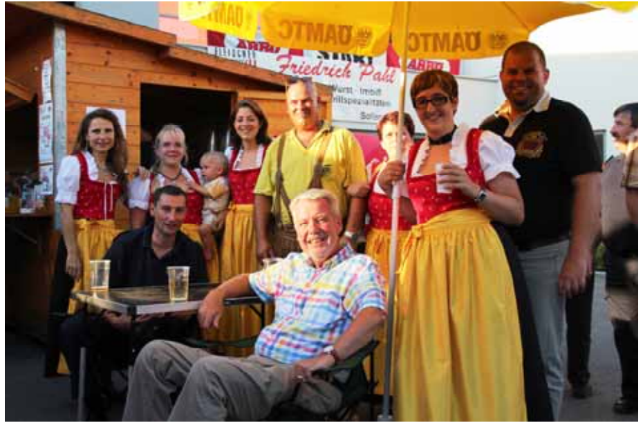
Kommandantenbesprechung bei einem Bier mit Herz und Seele