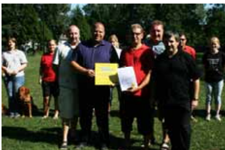
Danke dem ÖGV Felixdorf