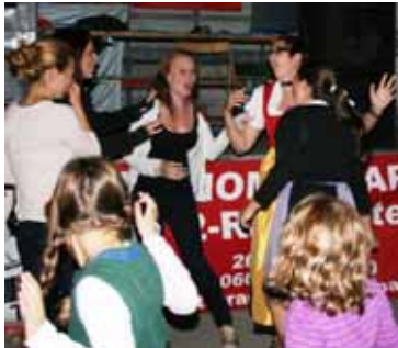
es wurde gesungen und getanzt