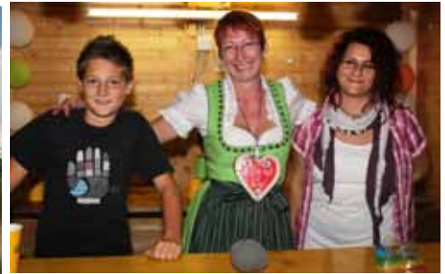
Evas Dosenwurfhütte für Groß und Klein