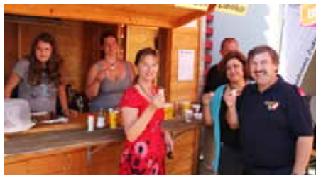
ein Eierlikörchen in Ehren, kann ...