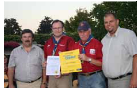
Danke den Pfadfindern Felixdorf