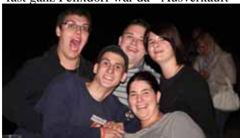
zum Schreien geil war's...