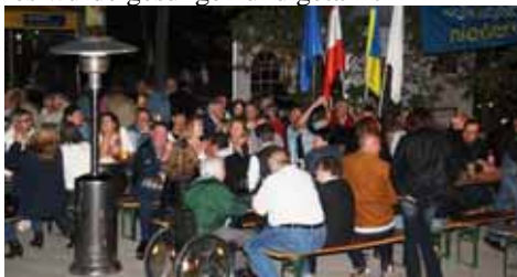
fast ganz Felixdorf war da - Ausverkauft