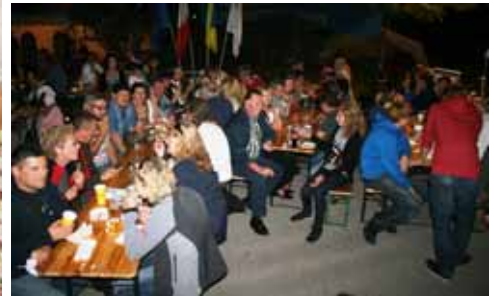
riesen Andrang und tolle Stimmung