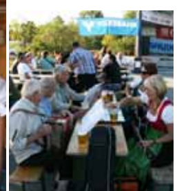
junge Dirndl und super Volksmusikanten